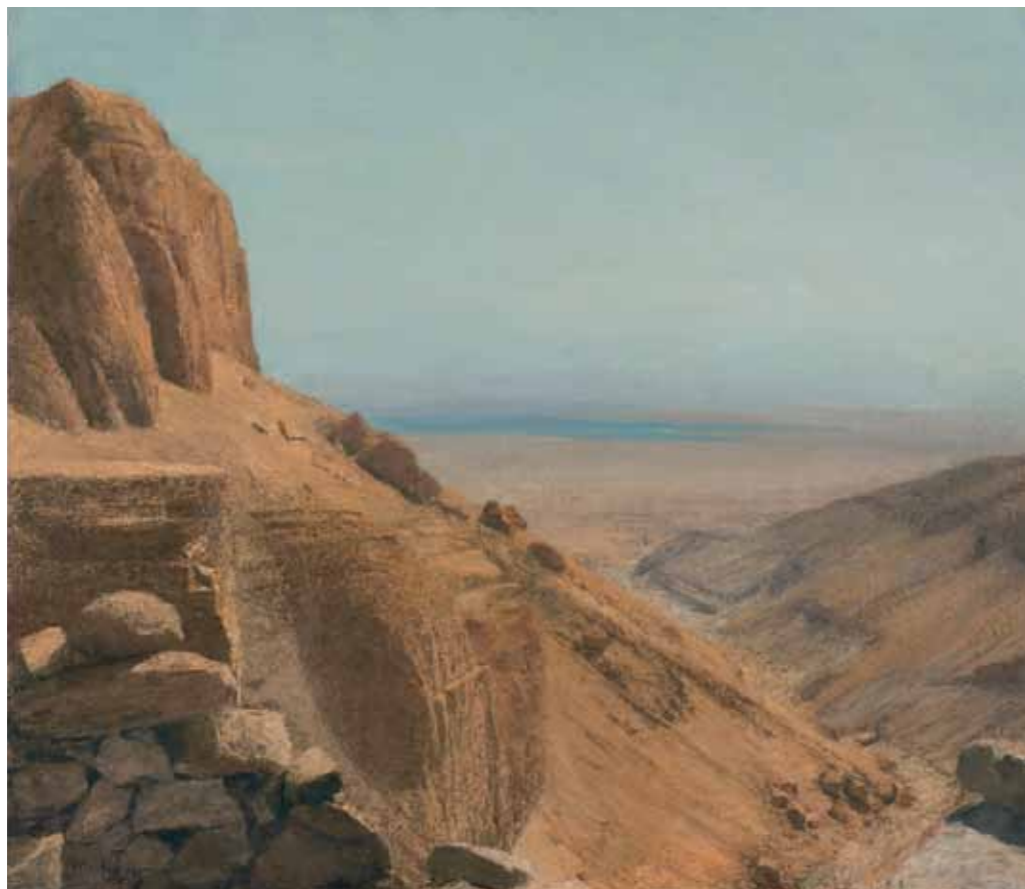
The Southern Slope of Masada Oil on canvas 95x110 cm