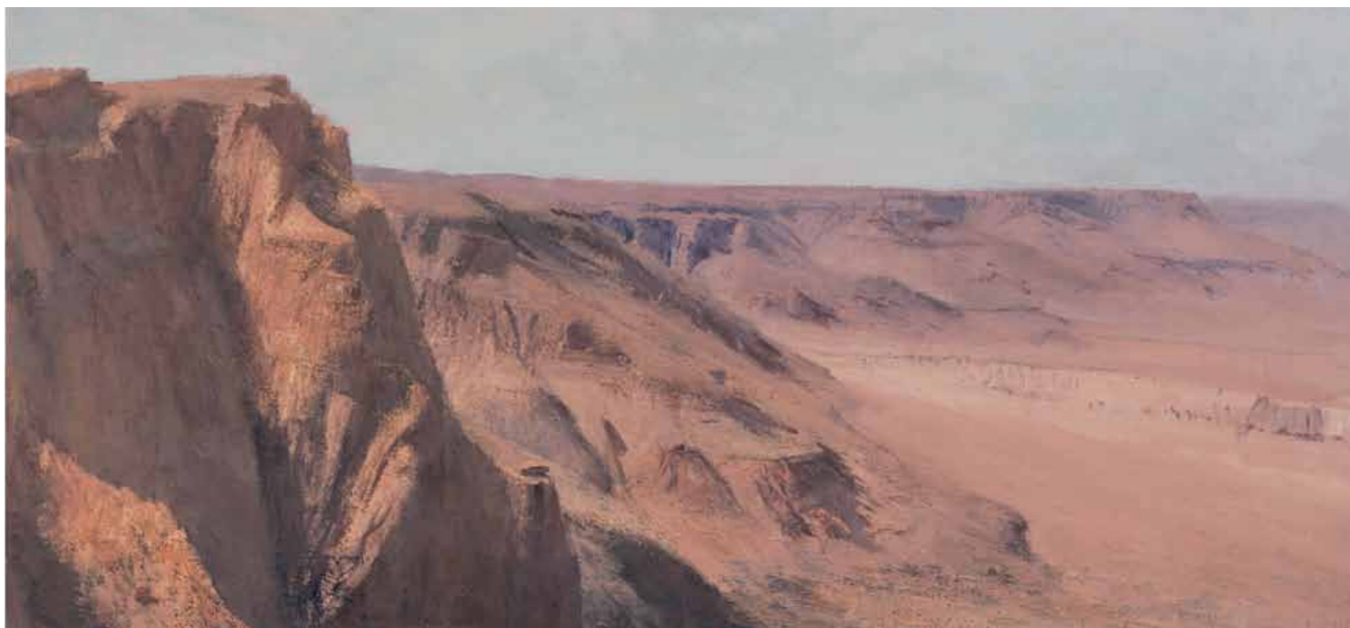
Landscape with a Rock Oil on canvas 47x100cm