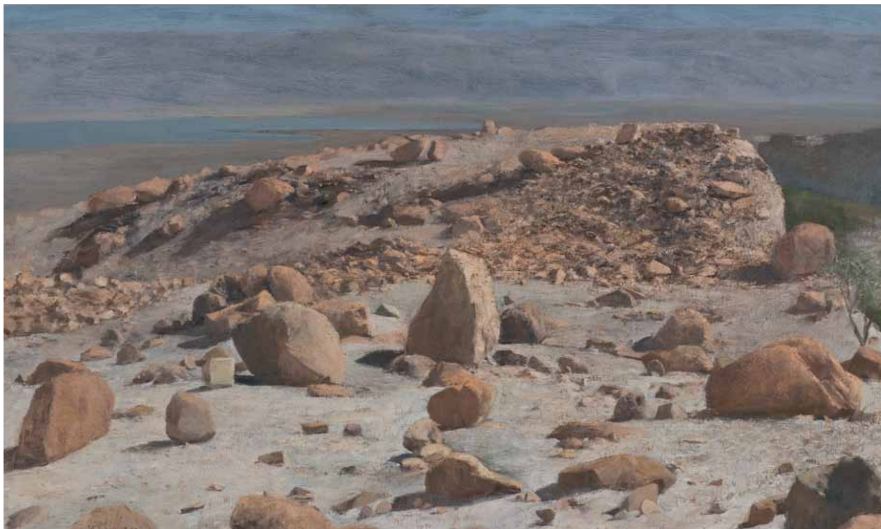
Masada Barrier Oil in canvas 75x125 cm