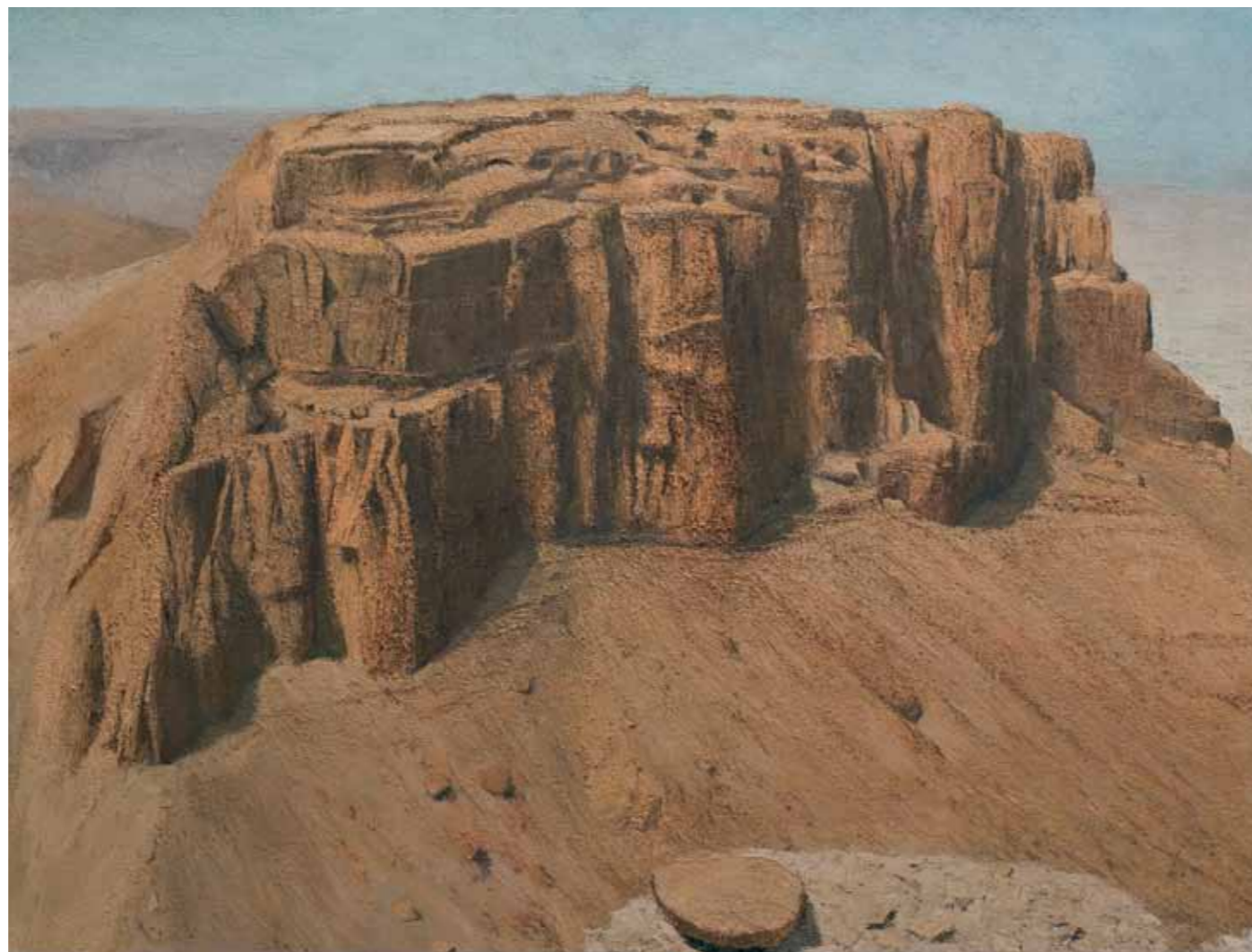
Masada from the Eighth Camp Oil on canvas 95x125 cm