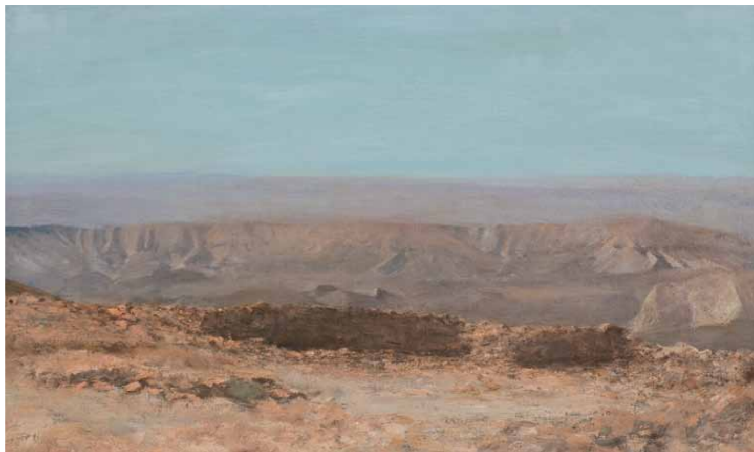
Looking South from the Eighth Camp Oil on canvas 60x100 cm

מבט דרומה מהמחנה השמיני שמן על בד 60x100 ס"מ