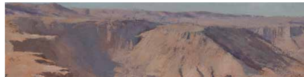
View from the Watergate Oil on linen mounted on plywood 11x40.5 cm