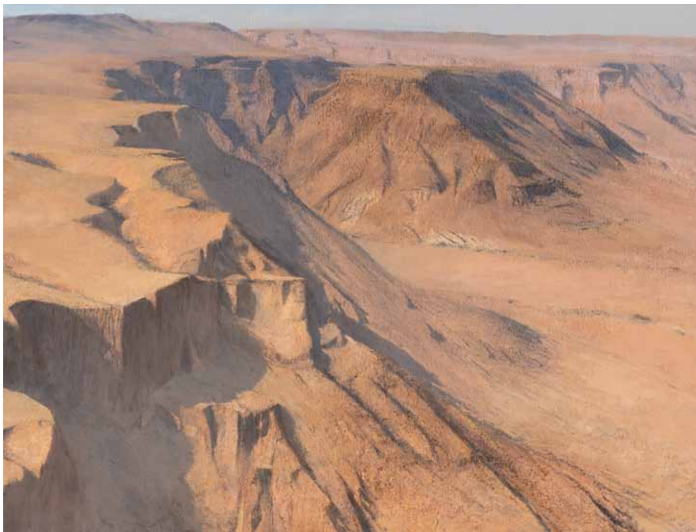
The Cliff Oil on canvas 95x125 cm