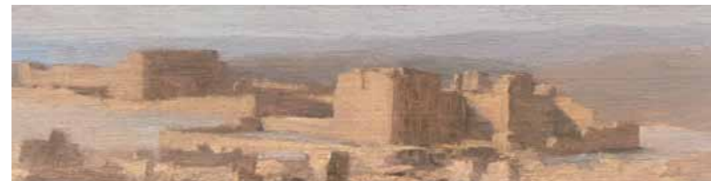
Masada - Byzantine Church and the Western Palace Oil on linen mounted on wood 9.8x38cm

כנסיה ביזנטית בשעות אחר הצהריים שמן על נייר 20.5x29.5 ס"מ