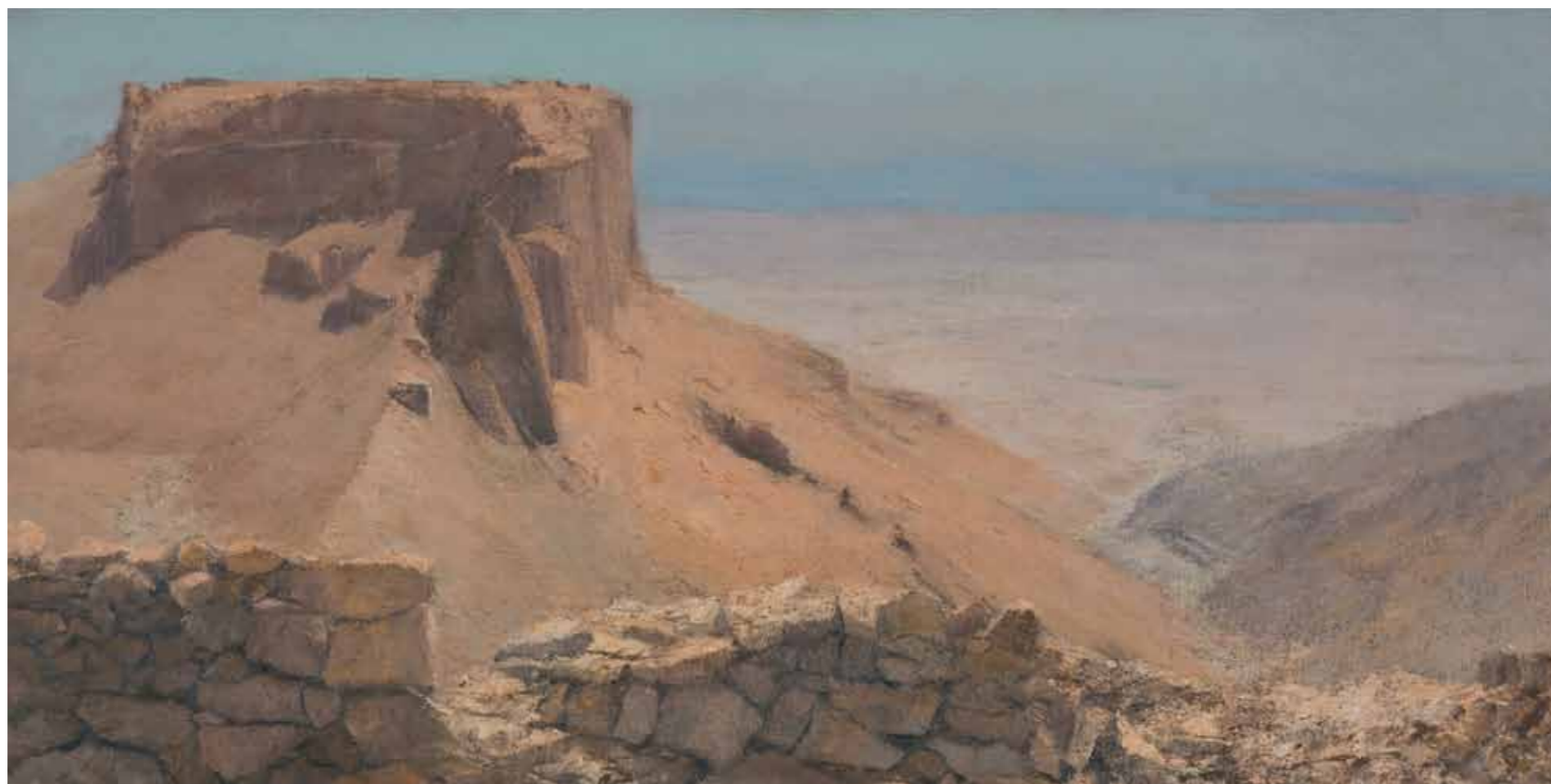
Stone Wall near Masada Oil on canvas 50x100 cm