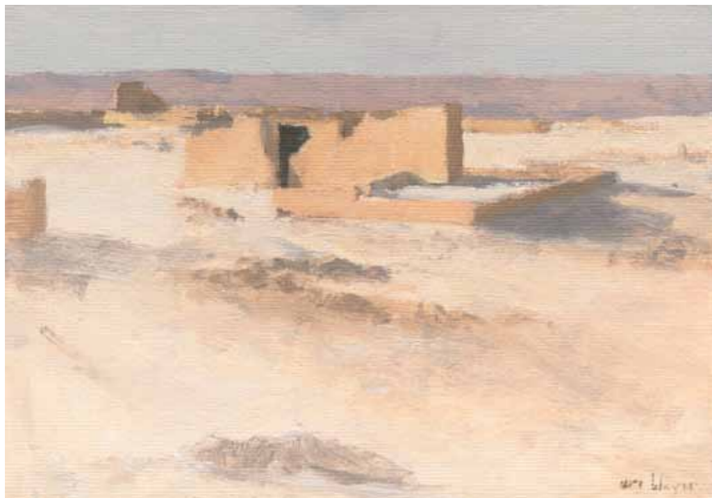
Byzantine Church in the afternoon Oil on paper mounted on plywood 20.5X29.5 cm

כנסיה ביזנטית בשעות אחר הצהריים שמן על נייר 20.5x29.5 ס"מ