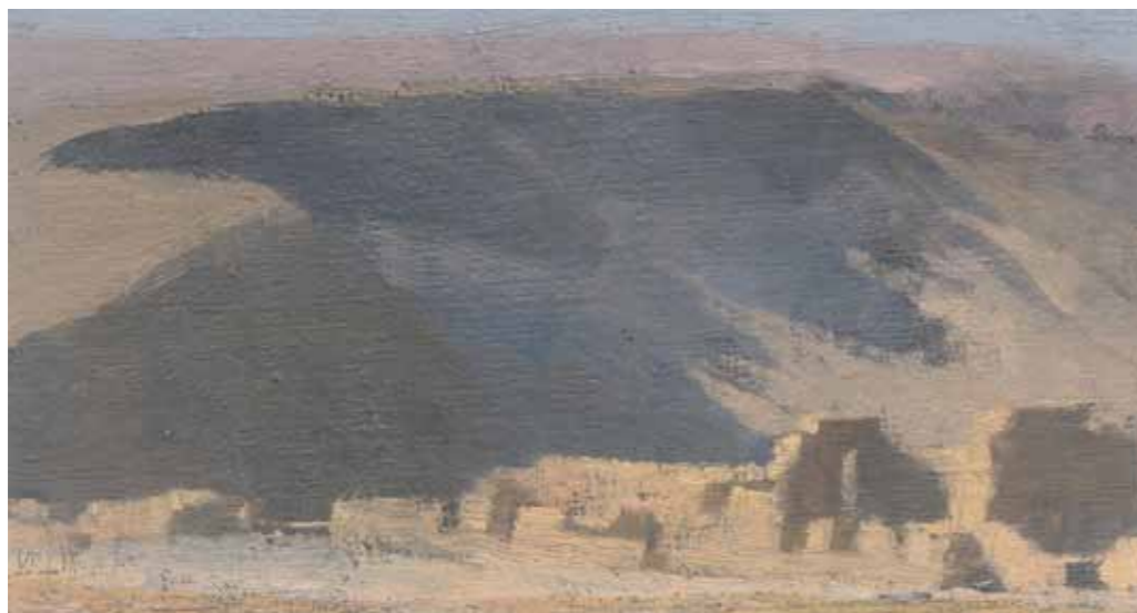
The Break in the Fence Oil on canvas mounted on plywood 17.5x31.5 cm