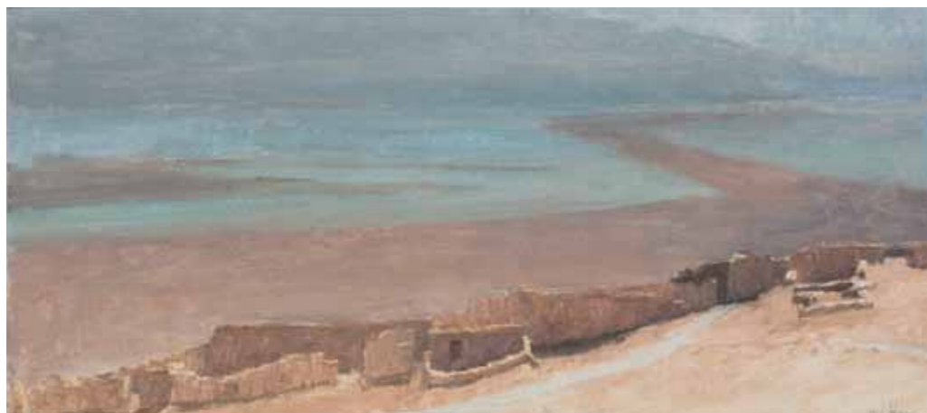
Kanaim's Dwelling Oil on canvas 19.5x44cm