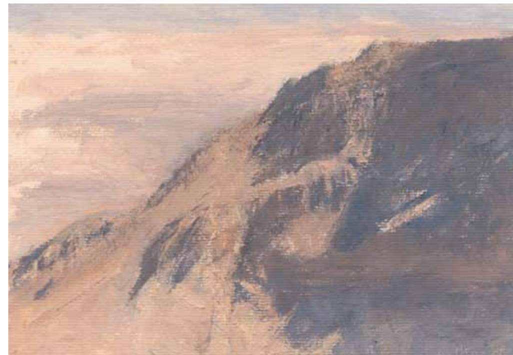
Elazar Mountain from Eastern Observation Point Oil on paper mounted on plywood 20.5x29.5 cm

הר אלעזר מהתצפית המזרחית שמן על נייר 20.5x29.5 ס"מ