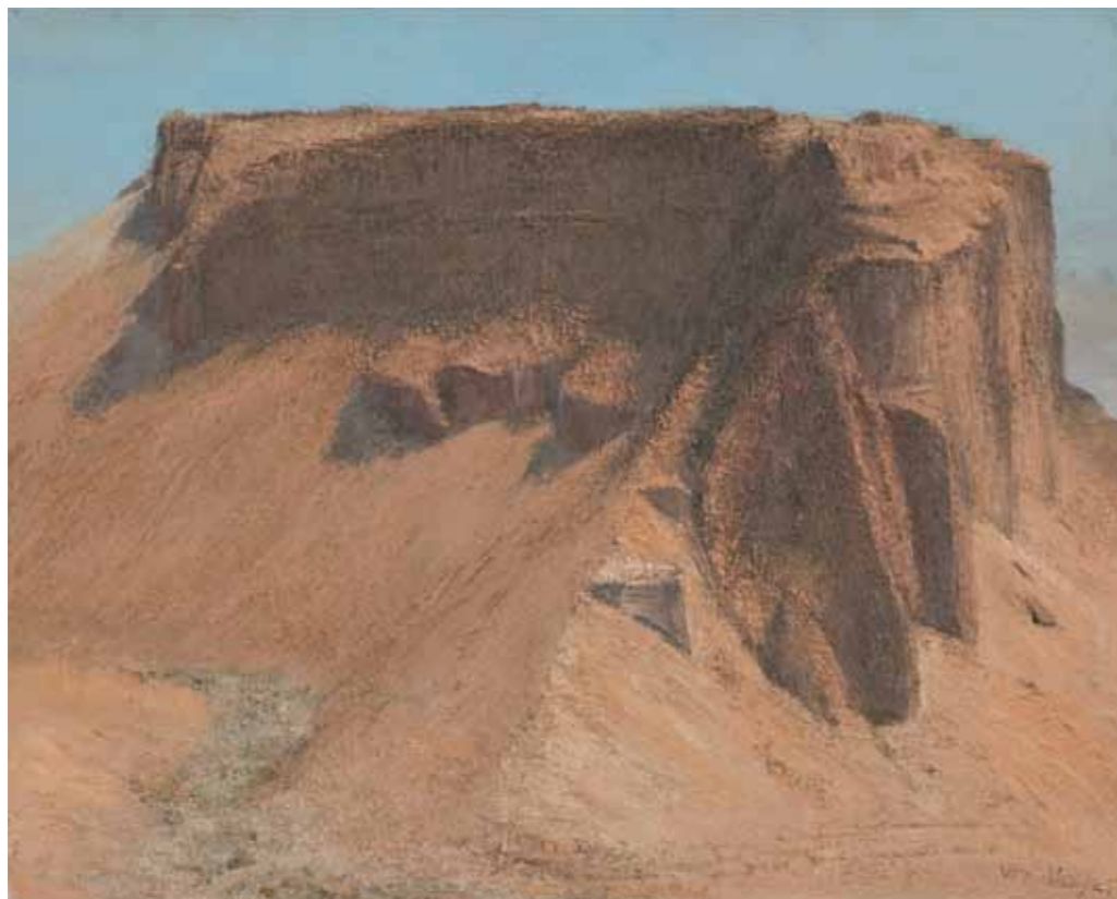
Masada Morning Oil on canvas 40x50 cm