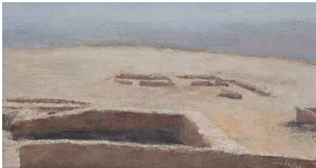
Ruins, House of Torah Oil on canvas 17x32 cm