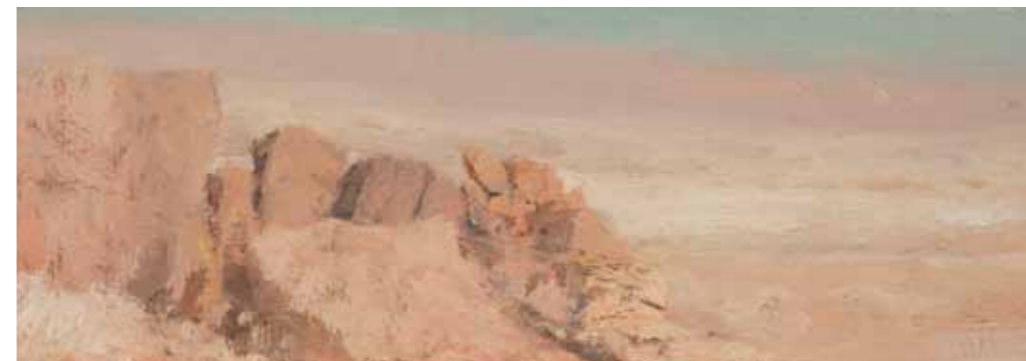
A View from the Snake Path Oil on linen mounted on plywood 16x44 cm

ארמון קטן עם ים המלח ברקע שמן על בד 10x22.5 ס"מ