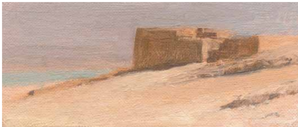
Small Palace with Dead Sea in the distance Oil on linen mounted on plywood 10x22.5 cm

ארמון קטן עם ים המלח ברקע שמן על בד 10x22.5 ס"מ