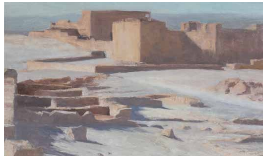
Byzantine Church from Rebels' Dwelling Oil on canvas 36x60 cm

כנסייה ביזנטית ממגורי מורדים שמן על בד 36x60 ס"מ