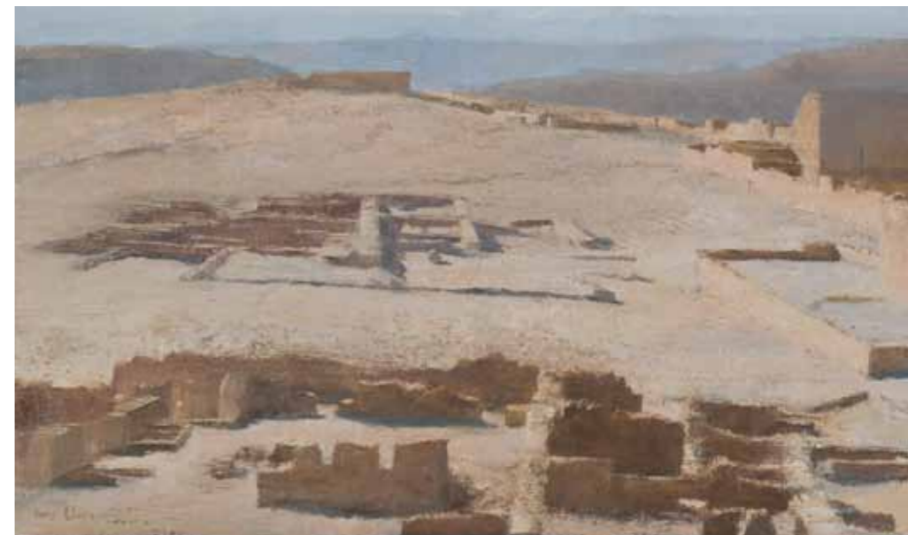
Looking South from the Watch Tower Oil on canvas 28x48 cm

מבט דרומה ממגדל השמירה שמן על בד 28x48 ס"מ