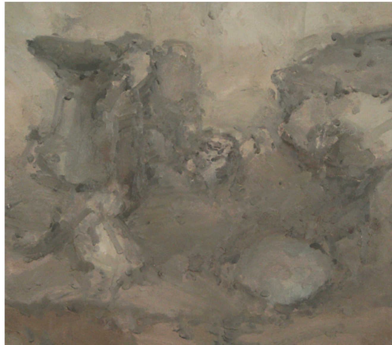
Femme with Canine V Oil on Linen / 2007 102x122 cm