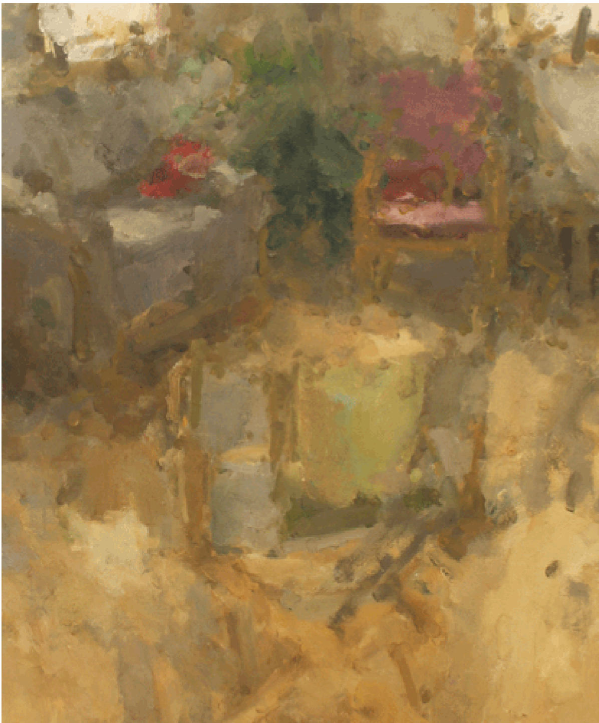
Bad Brains מוחות מורעלים Oil on Linen / 2007-8 שנתן על בד / 2008-2007 51X46 cm סמ 46x51