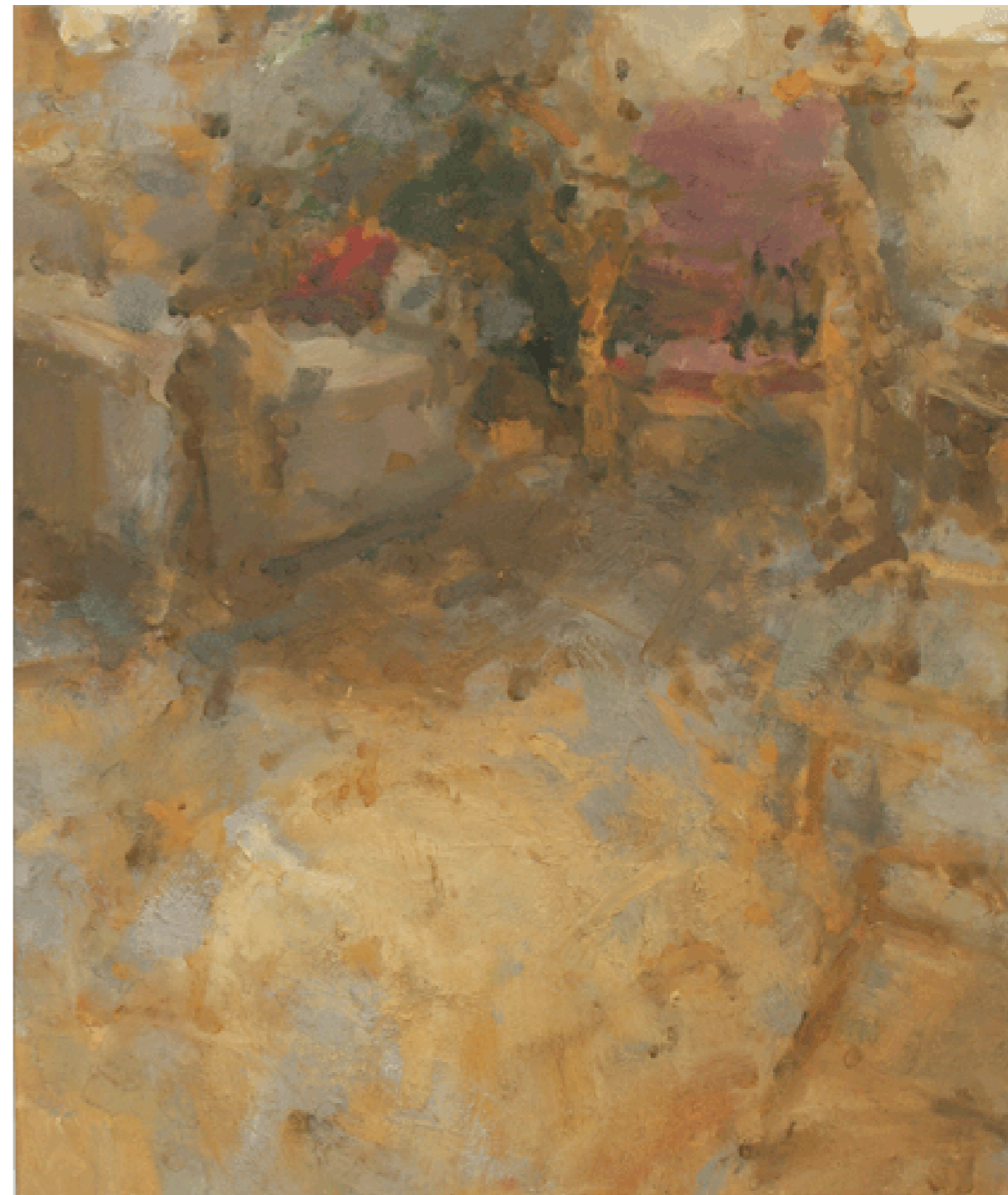
My Friends החברים שלי Oil on Linen / 2006-8 שנתן על בד / 2008-2006 56X46 cm סמ 46x56