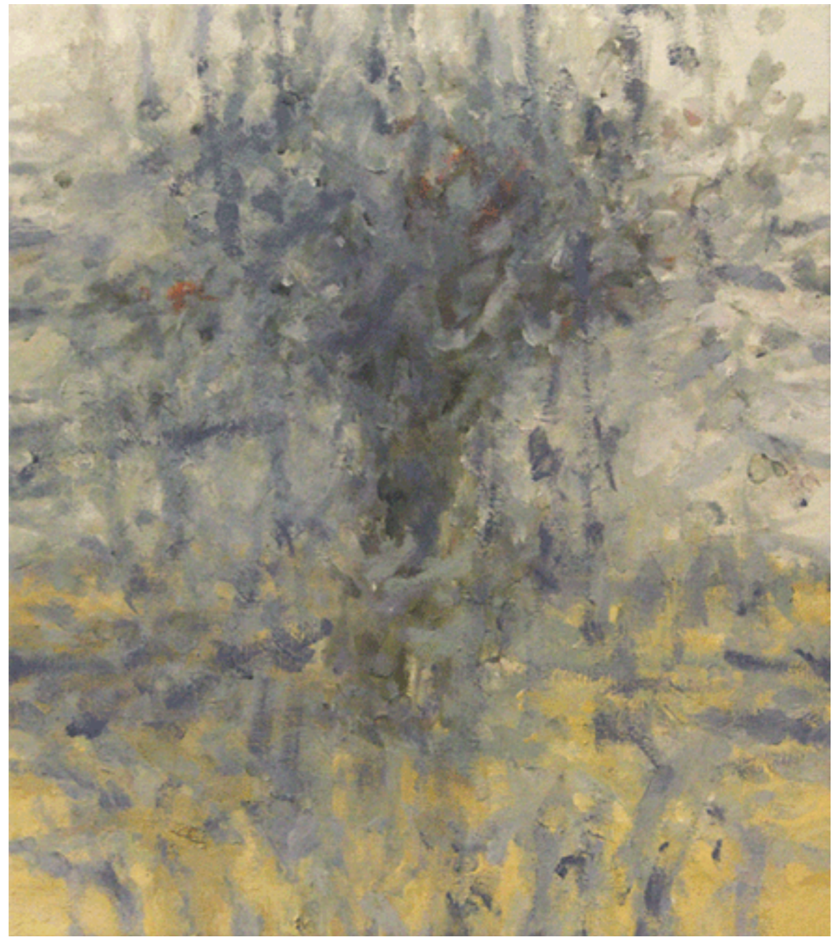
Lost Dog Oil on Linen / 2006 51x46 cm כלב אבוד שמן על בד / 2006 46x51 סמ