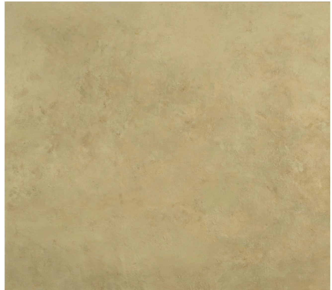
The Last One Oil on Linen / 2006-7 46x51 cm