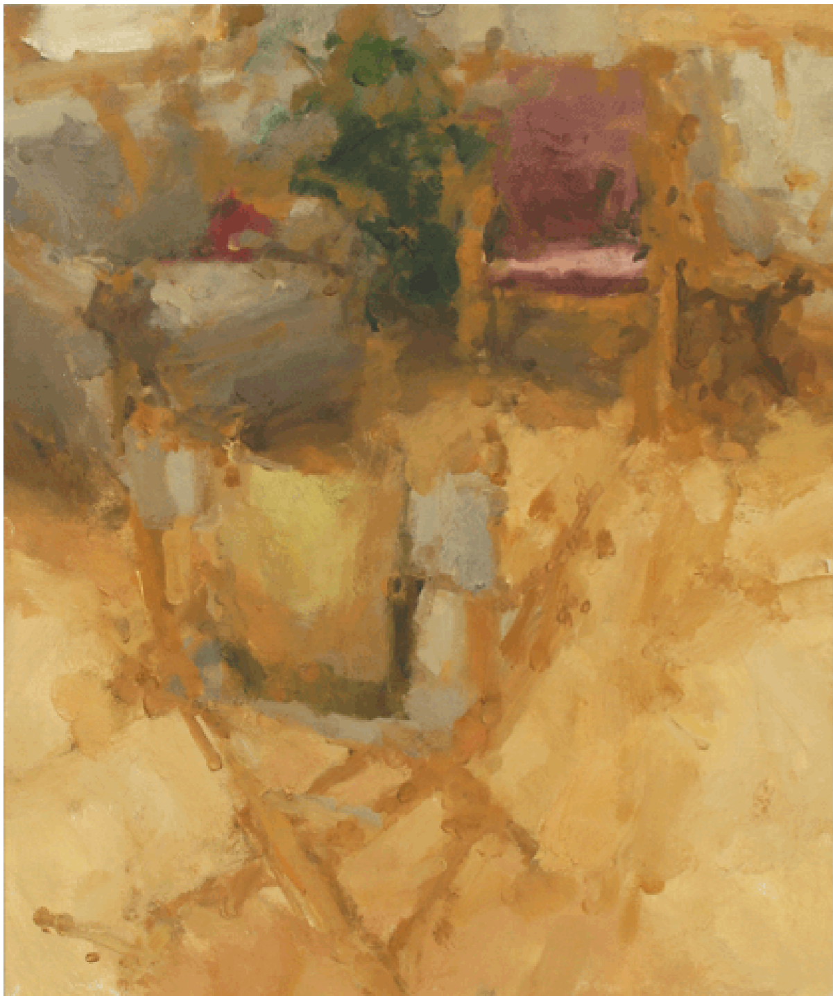
Literal II Oil on Linen / 2008 122x102 cm